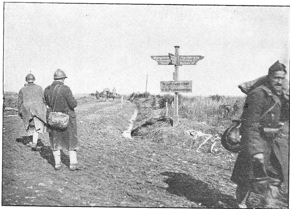
Le carrefour de Westroosebeeke.